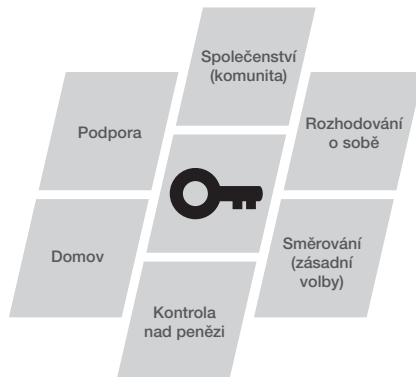
Obrázek 1 - Klíče k aktivnímu občanství – volně dle Duffy

ní tohoto typu důstojnosti, resp. provádění s dalšími právy se nabízí následující schéma, které definuje základní oblasti plnohodnotného občanského života člověka: 13